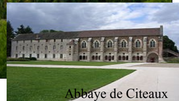
Abbaye de Citeaux

Randonnée N°1 Vins de Bourgogne, moines et vignes